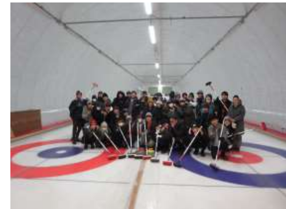
冬季スポーツ体験(カーリング)(1月)