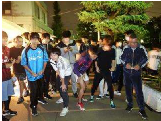
ロードレース大会(11月)