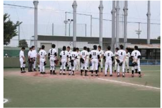
部活動 日々の練習は、21:00～