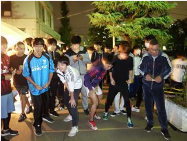
ロードレース大会(11月)